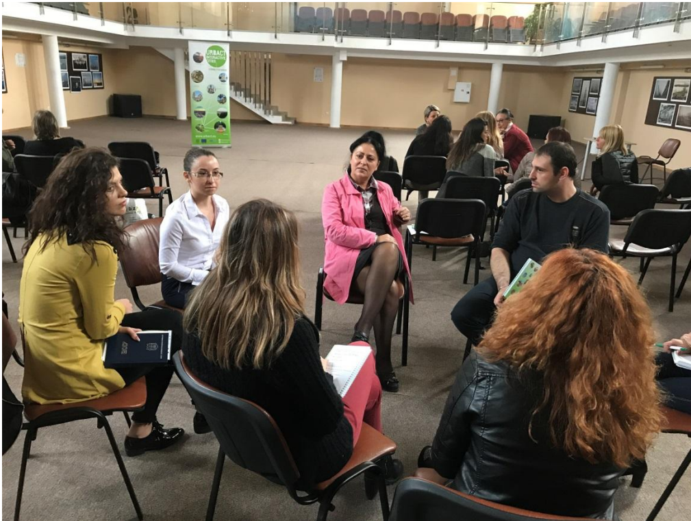
Семинар „Дигитален маркетинг в туризма“